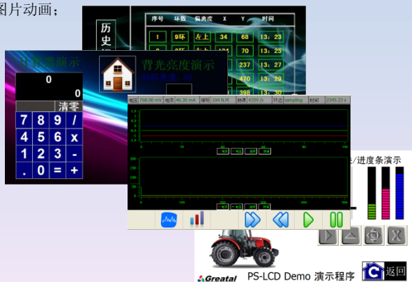
实际界面运行效果